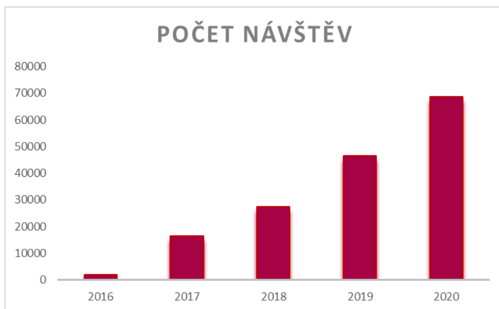
Graf 1 | Sledovanost webových stránek projektu (počet návštěv)

Detailní data: 2016 (650 unikátních návštěvníků; 2 046 návštěv; navštívené stránky 14 197; hity 30 272; přenesená data 460 MB), 2017 (7 083 unikátních návštěvníků; 16 583 návštěv; navštívené stránky 72 037; hity 119 530; přenesená data 1,72 GB), 2018 (8 330 unikátních návštěvníků; 27 317 návštěv; navštívené stránky 89 818; hity 154 299; přenesená data 2,34 GB), 2019 (12 529 unikátních návštěvníků; 46 518 návštěv; navštívené stránky 89 220; hity 163 894; přenesená data 2,56 GB), 2020 (15 061 unikátních návštěvníků; 68 559 návštěv; navštívené stránky 144 854; hity 256 352; přenesená data 4,45 GB).